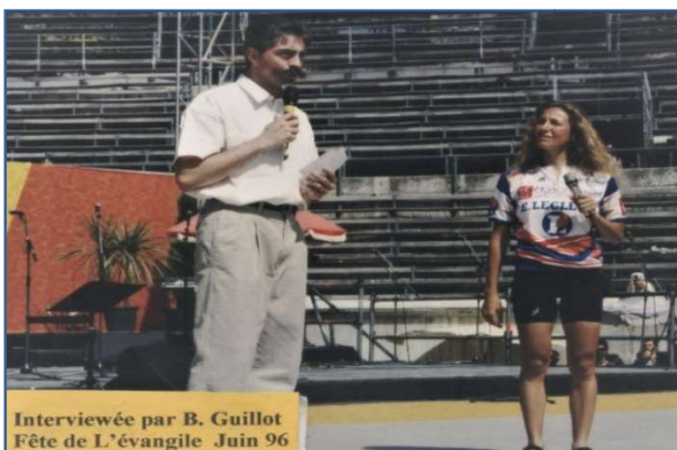
Interviewée par B. Guillot Fête de L'évangile Juin 96